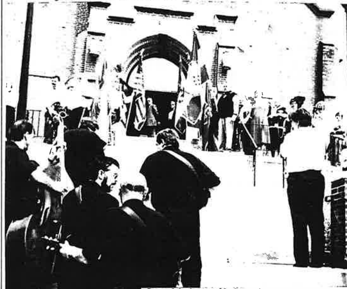
Gosti i domaćini u Pittsburghu, HBZ

"HRVATSKA ISKRA" - Broj 82, 15. V. 2001.