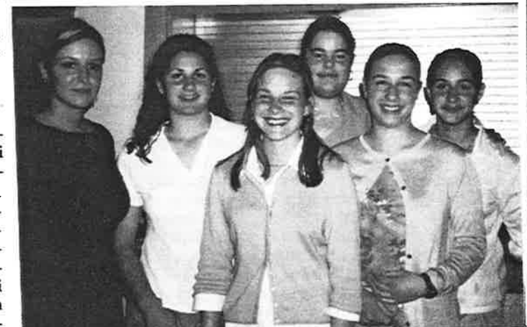
MLADI ŽUPIJANI ŽUPE "PRESVETOG TROJSTVA" SA SMJEŠKOM SU RADILI ZA DOBROBIT BANKETA ZA POMOĆ GOSPIČKO-SENSKOJ BISKUPIJI

Poduzeće Jamnica predstavilo je novo pakiranje negazirane prirodne mineralne vode u plastičnim bocama od pola litre s tzv. sportskim čepom, a na etiketama uz tekst na hrvatskom i engleskom nalazi se lik naše skijašice Janice Kostelić. Promocija "plave vode" održana je na štandu Jamnice na Proljetnom međunarodnom zagrebačkom velesajmu, a na promociji je uz Janicu bio i njezin brat Ivica kojeg Jamnica također sponzorira. Janica se pritom potpisala na dio od pripremljenih 1256 boca. Prema riječima direktora marketinga Jamnice Marija Scherra, Janica i Jamnica će i dalje nastaviti međusobnu suradnju na obostranu korist. On je zaželio Janici uspjeh u daljnjoj karijeri, posebno na Olimpijskim igrama 2002. te spomenuo da se uspjesi očekuju i od Ivice koji je nedavno sanirao ozljedu. (Vjesnik)