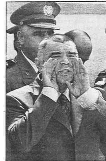
Predsjednik Mesić uzvratio na uvrede

"HRVATSKA ISKRA" - Broj 82, 15. V. 2001.