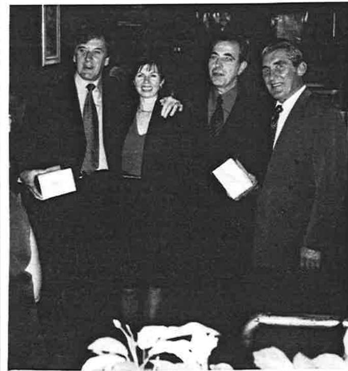
Jedna od pobjedničkih ekipa, kuglačko društva "Zagreb"

Postoji posve pozitivan konzervativizam, kao i napredan nacionalizam, posebice u malih naroda, koji se bore za svoj opstanak, a takvi su Hrvati. Nacionalizam ima na Zapadu negativan prizvuk, što i ne začuđuje jer su se tamošnje nacije odavno time "zasitile", ali u Trećem svijetu, kao i među narodima koji još nisu učvrstili svoje države nacionalizam nije sramota. I biti konzervativan sasvim je časnog jer to znači čuvati sve pozitivne vrijednosti iz prošlosti i ne trčati za pomodnim kretanjima po svaku cijenu.