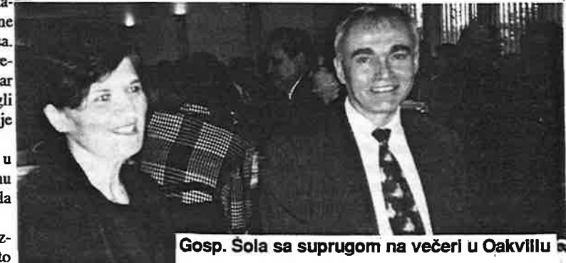
Gosp. Sola sa suprugom na večeri u Oakvillu